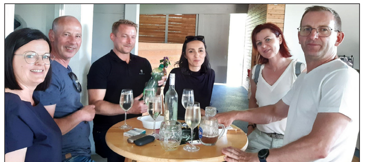
Auch für eine Stärkung war zwischen den spannenden Matches Zeit.