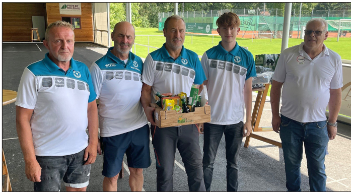
2. Platz für die Stocksportler aus Laßnitzthal