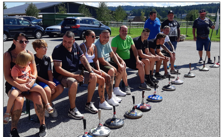
Kurze Verschnaufpause bei heißen Temperaturen!

Somit ist alles wieder offen und man darf auf eine spannende Revanche beim Knödelschießen im Winter gespannt sein.