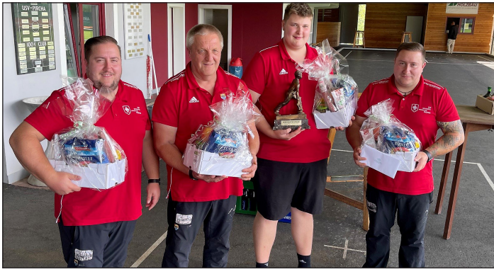
Das siegreiche Team des ESV Prüfing