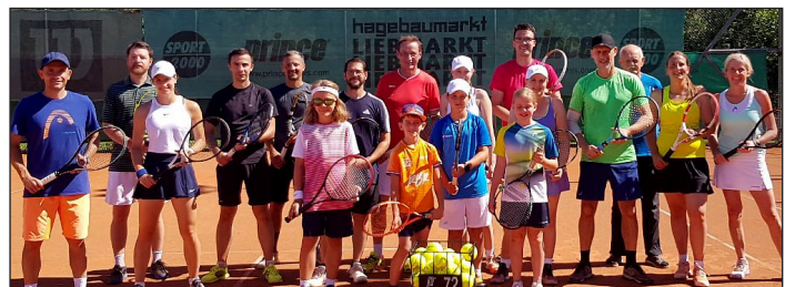
Die Teilnehmer*innen am diesjährigen Tenniscamp des TC Pircha.

Der Mitgliederstand betrug heuer 103 Erwachsene und 25 Kinder. Im kommenden Jahr steht der TC Pircha vor einer Großsanierung der Tennisplätze. Die letzten 35 Jahre wurden die Plätze immer von den Mitgliedern selbst hergerichtet. Nächstes Jahr muss sich jedoch eine professionelle Firma dieser Aufgabe annehmen.