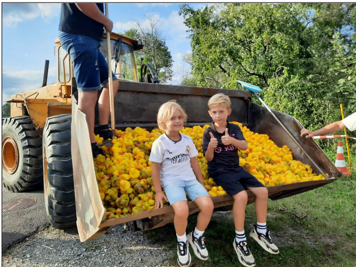
Begeisterung für das alljährliche Ententrenen beim hoffnungsvollen Nachwuchs!

Ein großer Erfolg war auch heuer im September wieder das Ententrenen des USV Pircha für Groß und Klein. Über 10.000 (!) Enten konnten verkauft und 180 Enten an die Kinder verschenkt werden. Groß war die Begeisterung auch über die wunderschönen Preise, die es zu gewinnen gab, sowie über das Gratiseis, welches von der SPÖ Ludersdorf-Wilfersdorf gesponsert wurde.